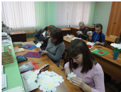
Благотворительные акции «Дети-детям», «Белая ромашка»