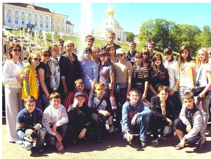
Поездка в Санкт- Петербург