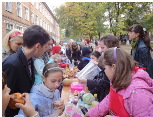
Праздник «Дары осени»

На высоком, творческом уровне проводятся общешкольные праздники, в которых участвуют все учащиеся школы, родители, приглашаются представители общественности, ветераны войны и труда. Это «День знаний», «День здоровья», спортивный праздник «Папа, мама, я - спортивная семья», «День краеведения», «День флага Белгородской области», праздники микрорайона «Дары осени», «Новогодний серпантин», «Рождество Христово», «Широкая Масленица», «День улицы Шершнева Н. Л.», праздничные дискотеки, «Последний звонок», «Выпускной вечер» (11-е классы), торжественная линейка (9-е классы), торжественная линейка «Наши достижения» (2-8,10 классы), «Последний звонок», «Выпускной вечер» (11-е классы).