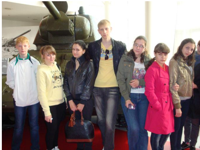
Экскурсия в Прохоровку